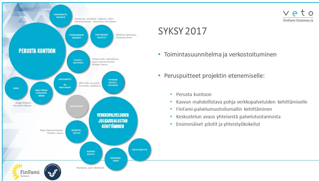
Kuva 2. VETO-syksy 2017